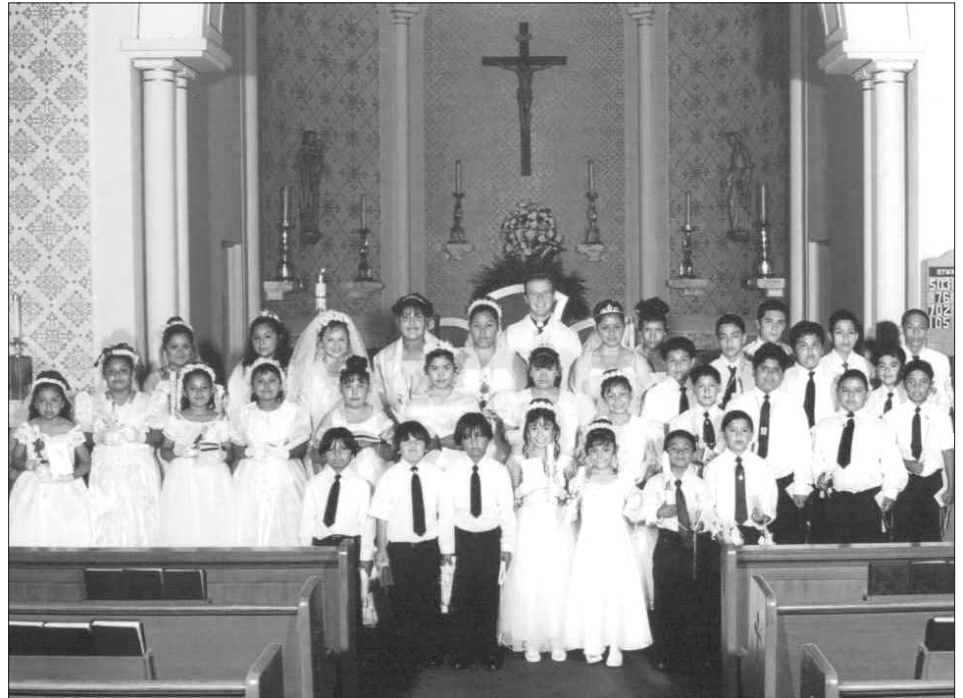
La clase de Primera Comunión de niños hispanos en la Iglesia de Nuestra Señora del Lago incluyó a 36 miembros de la parroquia entre las edades de 7 y 17 años.

Como resultado de ello y por primera vez, se comenzaron a dar clases de Primera Comu-