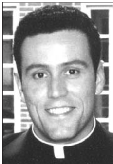
Nuestra Fe Católica