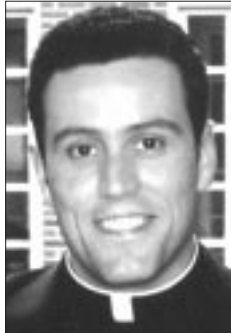
Nuestra Fe Católica

En una ocasión sus padres lograron que él entrara al convento de los Hermanos Franciscanos, pero no resistió y se fugó regresando a casa para continuar en las andadas. Trató de ayudar a su padre en el taller de platería pero como el dinero no rendía, decidió su padre enviarlo a las Filipinas a buscar fortuna dedicándose a la importación y exportación de mercancías.