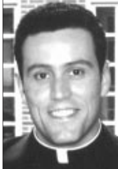
Nuestra Fe Católica

13 de julio de 1900, fue bautizada a los dos días con el nombre de Juana. Desde que entró a la vida religiosa con las Carmelitas Descalzas, y de acuerdo a la costumbre tradicional, le cambiaron de nombre, llamándola Teresa de Jesús, en recuerdo a la fundadora del Carmelo Teresiano, la gran Santa Teresa