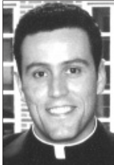
Nuestra Fe Católica

Es muy triste ver cómo esta práctica tan importante de nuestra fe se ha ido enfriando en muchos. No hay que verla con ojos de pesimismo, como si todo lo cubriera un velo de sufrimiento y muerte. Necesitamos celebrar con más ahínco la Resurrección, y no como un hecho aislado, triunfalista y descarnado de nuestra vida cotidiana. Hay que darle un profundo sentido a la muerte de Cristo y recordar de manera especial el Viernes Santo.