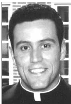
Nuestra Fe Católica

La fiesta de los Fieles Difuntos corresponde a una larga tradición en la fe Católica en la cual oramos por aquellos hermanos nuestros que han pasado a un plano distinto de existencia, ellos se encuentran en un estado de purificación llamado Purgatorio antes de alcanzar la perfecta y santa unión con Dios para toda la eternidad. Es un estado en el cual el alma alcanza su mayor esplendor, es decir, el esplendor de Dios, ya que es en Dios mismo donde el alma de los difuntos se va purificando y transformando.