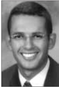
Carta del Seminario Mauricio Carrasco

La primera vez que yo pensé en el sacerdocio yo no estaba pensando en la